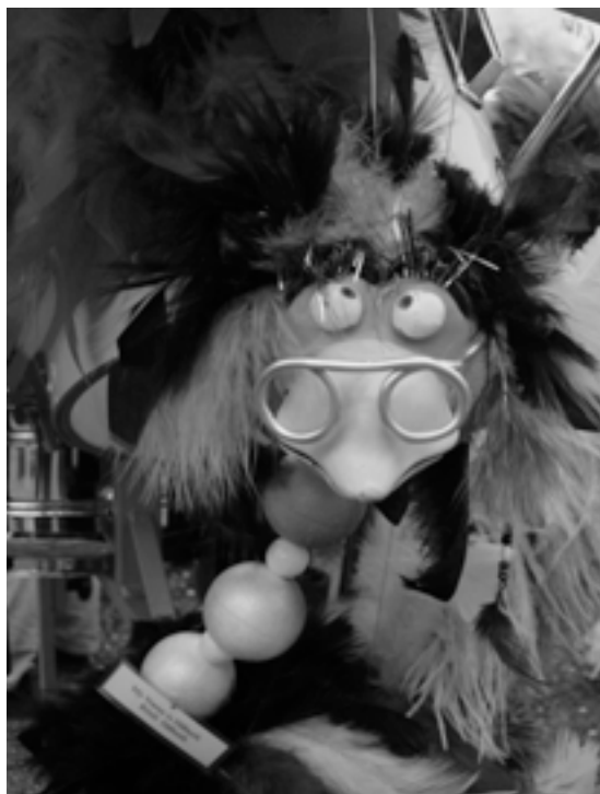
Impression von der Fasnacht 2007 mit den «Worbläufern»