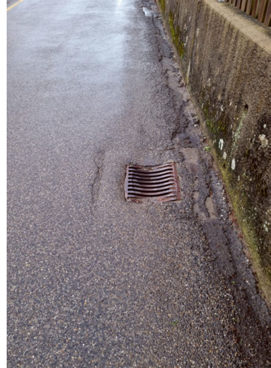
Bestehende Schäden im 1. Teil