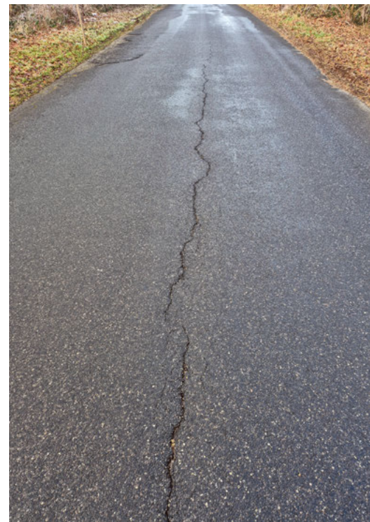
Bestehende Schäden im 2. Teil