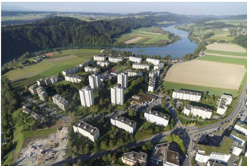
Der Wärmeverbund Kappelenring nutzt Seewasser als Energiequelle.