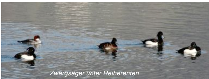
Zwergsäger unter Reiherenten

Das Rast- und Überwinterungsgebiet für Wasser- und Watvögel liegt in der Bucht zwischen Yverdon und Grandson. Das Gebiet, zu dem auch der Auenwald von