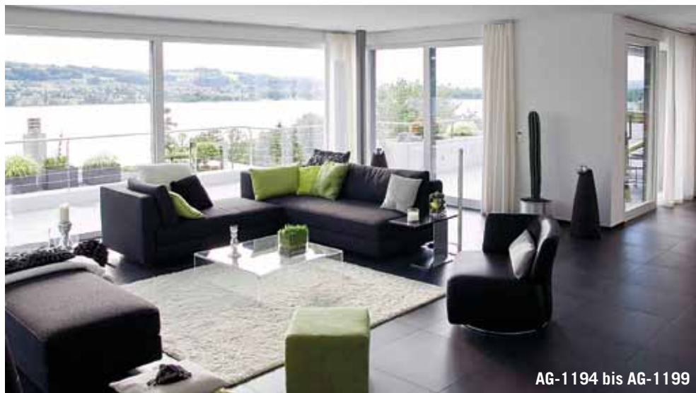
AG-1194 bis AG-1199